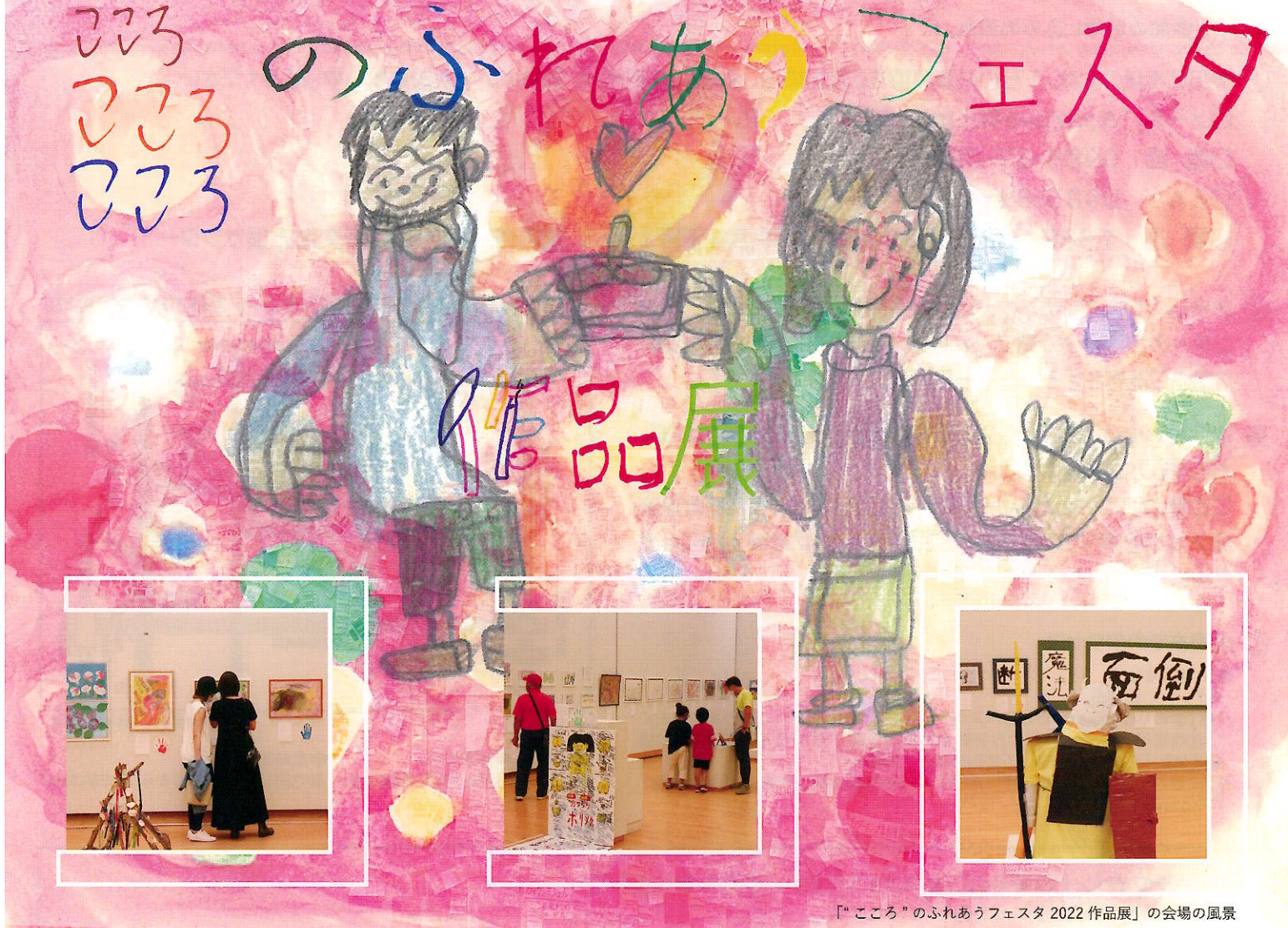
「“こころ”のふれあうフェスタ 2022 作品展」の会場の風景

「“こころ”のふれあうフェスタ 2023 作品展」は今年で第 10 回目を迎えます。宮崎県内の障がいのある方の作品を募集し、作品が持つ物語やその人らしさを一緒に感じていただけるような展示をしています。この作品展が、障がいのある方の社会参加を促すとともに、人生の豊かさや地域での生きやすさにつながるきっかけや交流の場になってほしいと考えています。その人や周りの人の思いがあふれる作品を、ぜひご覧ください。